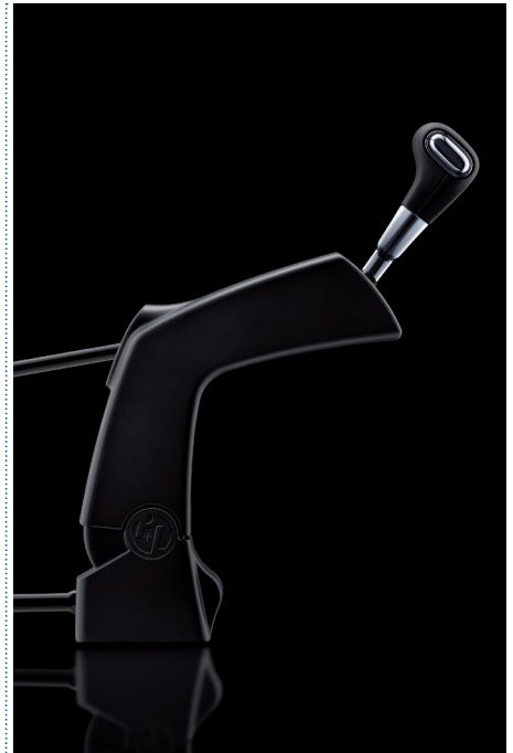
Multima® PRO - Einbausituation