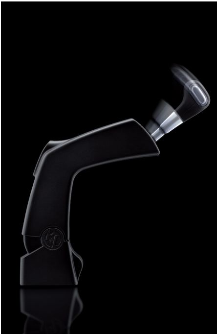
Multima® PRO - Gasgeben